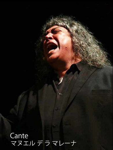
Cante マヌエル デラ マレーナ